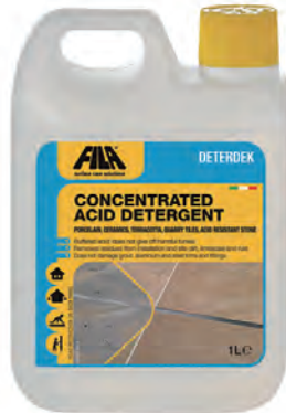
1 L ボトル 3,600 円 (税別) 磁器質タイル 1:5 (5倍) 40 m 2 /L