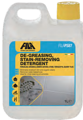
1 L ボトル 4,800 円 (税別)