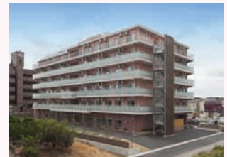
M 特別養護老人ホーム 外観北面