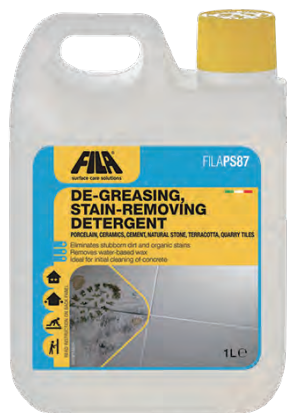
1 L ボトル 4,800 円 (税別)