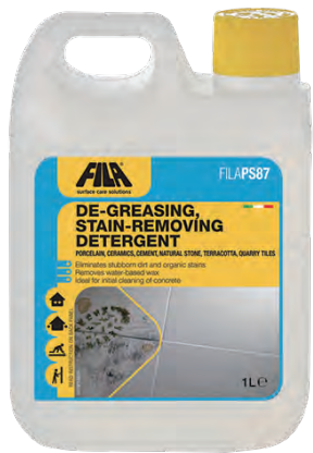
設計上代 (定価): 1L ボトル 4,800 円 (5,280 円税込)